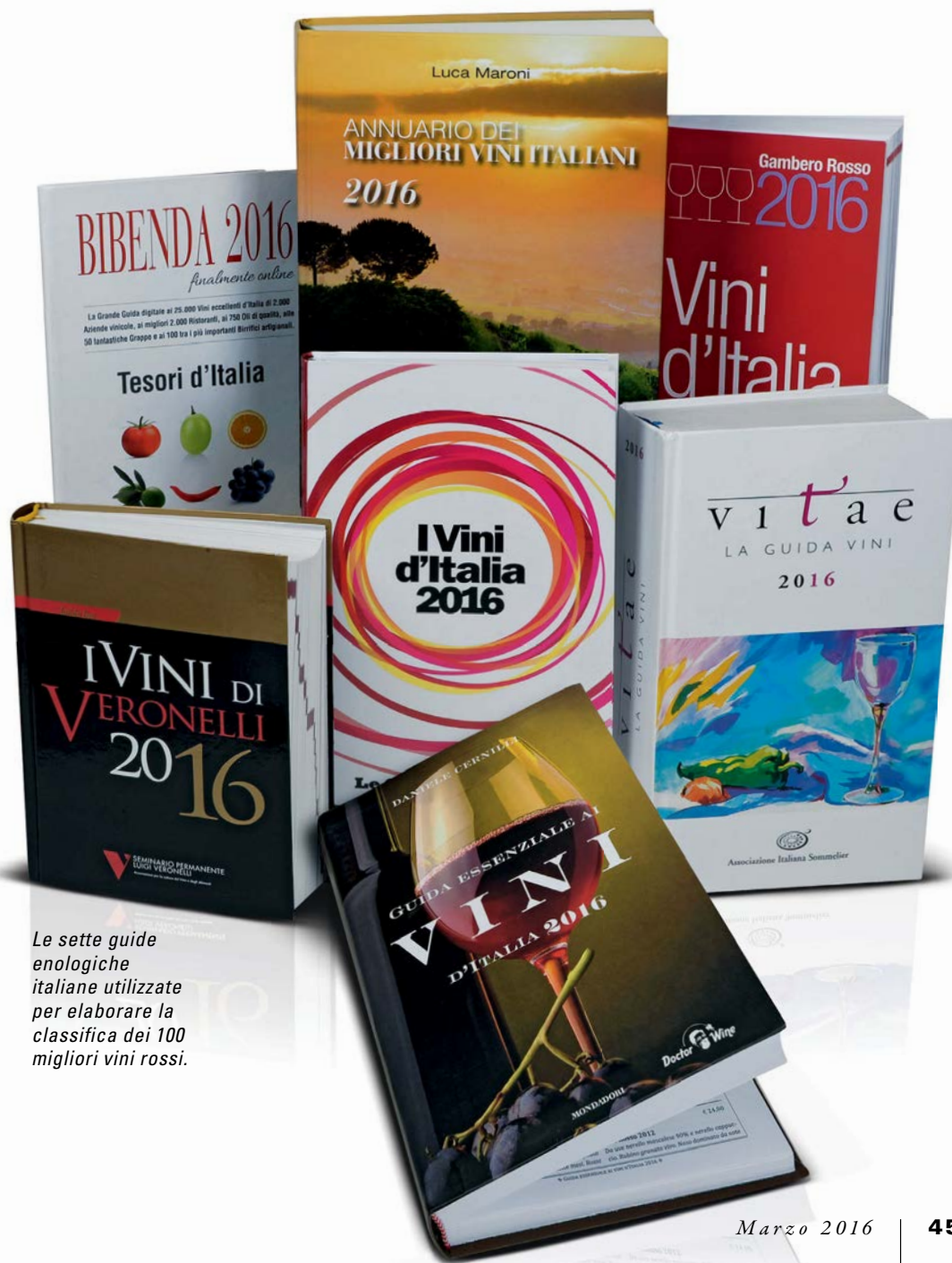
Le sette guide enologiche italiane utilizzate per elaborare la classifica dei 100 migliori vini rossi.

ha determinato la classifica. In cima alla classifica è tornato l'ES, il Primitivo di Manduria, spodestato l'anno scorso dall'intramontabile Sassicaia, che questa volta scivola in terza piazza, perché al secondo posto è balzato (non era mai successo) il Vigna Monticchio, la Riserva di Torgiano creata negli anni 70 del 1900 da Giorgio Lungarotti, precursore in Umbria del Rinascimento enologico italiano . In questa classifica dei migliori rossi italiani, compilata incrociando i voti delle guide dei vini, si avvertono inevitabilmente i contraccolpi della loro moltiplicazione: diventate sette l'anno scorso, le guide sentono come non mai l'esigenza di differenziarsi una dall'altra, e lo fanno cercando di scoprire vini inediti di produttori ancora sconosciuti , ma per sfoltire la scena e permettere agli emergenti di farsi notare hanno preso contemporaneamente l'abitudine di cancellare dalle loro pagine qualcuna delle bottiglie di più riconosciuto valore. Con queste esclusioni, però, è sempre più difficile per i vini d'alto profilo comparire in tutte